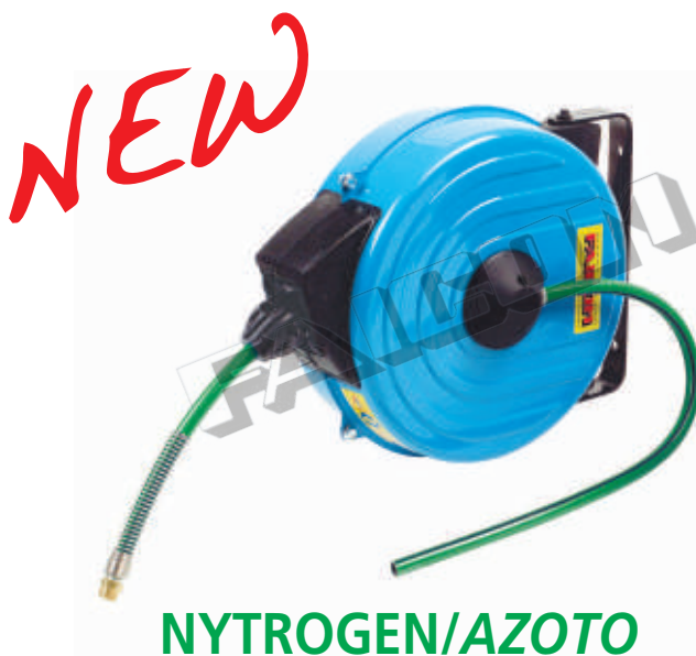
Hose reels model MGP with hose / Avvolgitubo modello MNP-MGP completi di tubo

I modelli sono forniti con tubo flessibile di collegamento lunghezza 1 m.