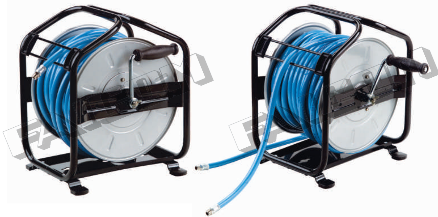
Hose reels model AM with and without hose / Avvolgitubo modello AM con e senza tubo

I modelli completi di tubo sono forniti con tubo flessibile di collegamento lunghezza 2 m.