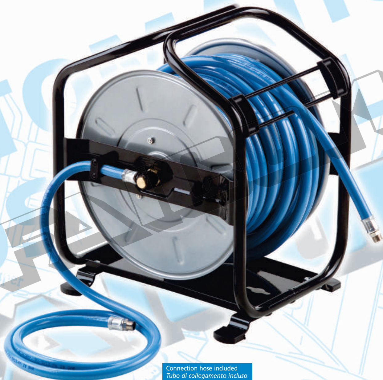
Connection hose included Tubo di collegamento incluso

The models with distribution hose are supplied complete with a 2 m flexible hose for the connection to the system.